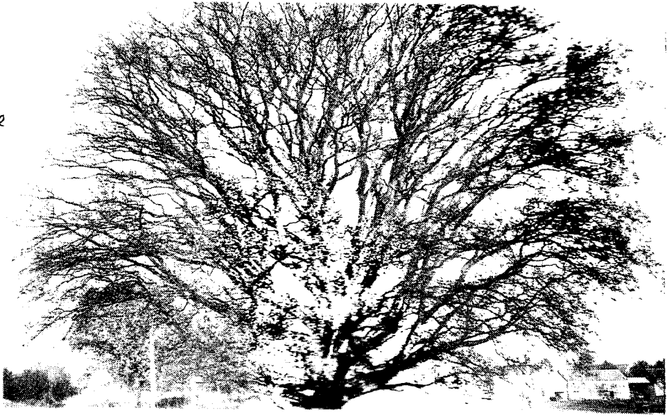
Le chêne de Langouët a remporté tous les suffrages

Parmi les arbres remarquables d'I & V, il faut encore citer les chênes